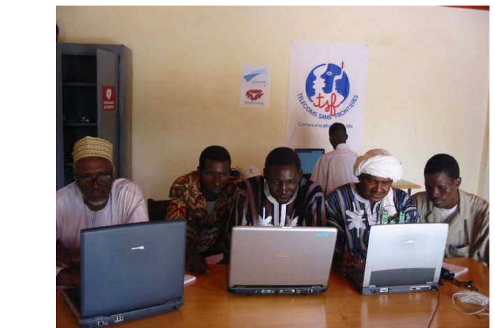
Le Centre Télécoms TSF en août 2005

Au-delà de l'accès à Internet et à un réseau informatique partageant les données de chaque organisation, le Centre IT Cup offrira également des formations informatiques et des initiations à Internet non seulement aux associations présentes et aux autorités de Dakoro mais au-